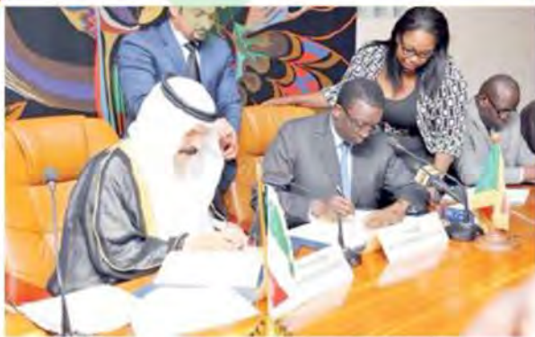
إعادة تأهيل الطرق وتنمية الزراعة في جمهورية السنغال

إسهامات الصندوق الكويتي للتنمية الاقتصادية العربية في القطاعات التنموية.