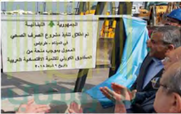
إنشاء مشروع الصرف الصحي في لبنان

أنشئ الصندوق الكويتي للتنمية الاقتصادية العربية في عام ١٩٦١م في عهد المغفور له الشيخ عبدالله السالم الصباح والذي يهدف إلى مساعدة الدول العربية والإسلامية وباقي دول العالم النامية.