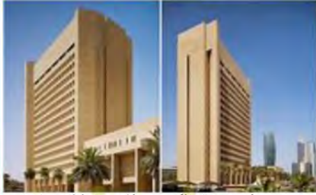
مبنى الصندوق الكويتي للتنمية الاقتصادية

أنشئ الصندوق الكويتي للتنمية الاقتصادية العربية في عام ١٩٦١م في عهد المغفور له الشيخ عبدالله السالم الصباح والذي يهدف إلى مساعدة الدول العربية والإسلامية وباقي دول العالم النامية.