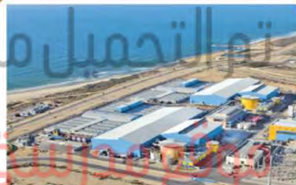
إنشاء محطة تحلية مياه البحر في جمهورية مصر العربية

إسهامات الصندوق الكويتي للتنمية الاقتصادية العربية في القطاعات التنموية.