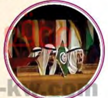
الشيخ جابر الاحمد الجابر الصباح