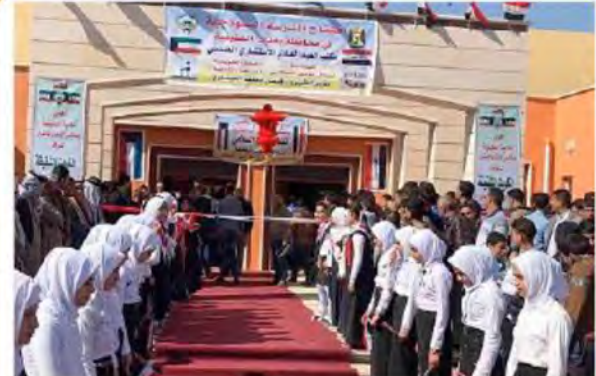
افتتاح مدارس تعليمية في العراق